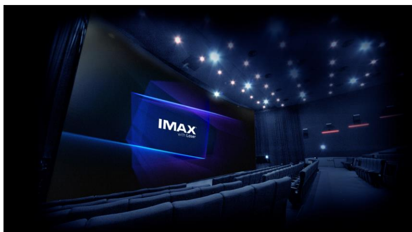
「IMAX ® レーザー」シアターイメージ